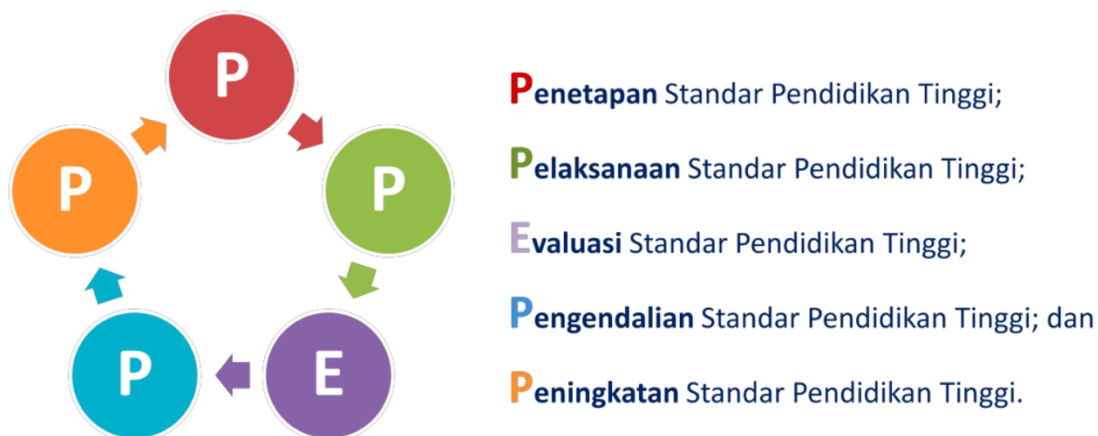
Gambar 1. Siklus PPEPP